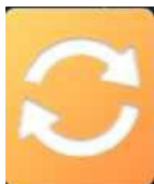
Imagine 5: butonul AUTOSTART - activare