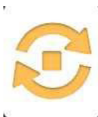
Imagine 6: butonul AUTOSTART - dezactivare