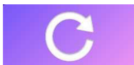
Imagine 4: butonul START