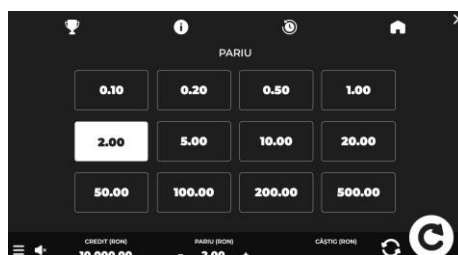
Imagine 8: Tabel cu variantele de pariuri