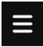
Imagine 6: butonul MENIU