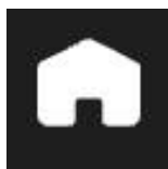
Imagine 9: butonul HOME