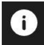
Imagine 8: butonul INFO