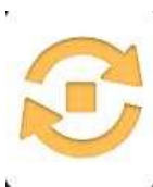
Imagine 6: butonul AUTOSTART - dezactivare