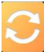
Imagine 5: butonul AUTOSTART - activare