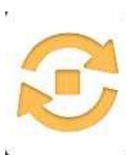
Imagine 6: butonul AUTOSTART - dezactivare