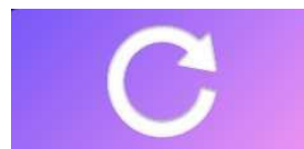
Imagine 4: butonul START