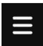
Imagine 7: butonul MENIU