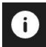
Imagine 10: butonul INFO