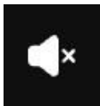
Imagine 6: butonul SUNET - dezactivat